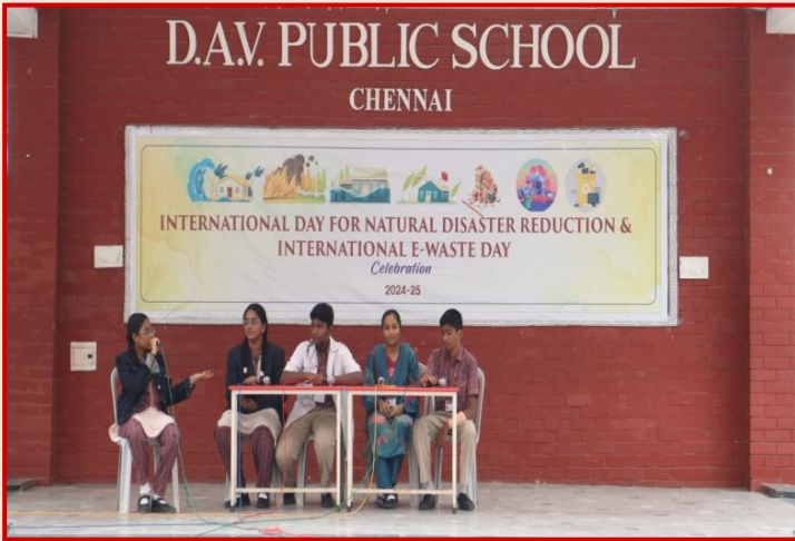
वायनाड भूस्खलन: कारण और उसके परिणाम पर चर्चा