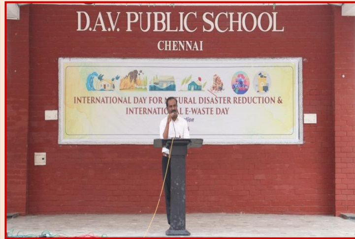
हमारे सम्मानित मुख्य अतिथि द्वारा प्रेरक और विचारोत्तेजक संबोधन