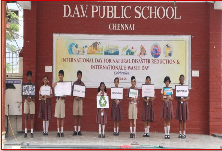
टॉक शो - स्पेक्ट्रम

अनुकूल तरीकों से उनका निपटान करने के तरीकों के बारे में भी बताया। उन्होंने हाइड्रोजन ईंधन संचालित भविष्य और परमाणु कचरा निपटान के तरीकों पर भी चर्चा की। इस समारोह ने विद्यार्थियों को आपदा प्रबंधन और ई-कचरा प्रबंधन के महत्त्व के बारे में जागरूक किया और उन्हें इन क्षेत्रों में योगदान करने के लिए प्रेरित किया। कार्यक्रम का समापन राष्ट्रगान और शांतिपाठ से हुआ।