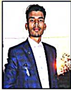
Sheshnarayan AIIMS Bhubaneswar Batch: MBBS-2021